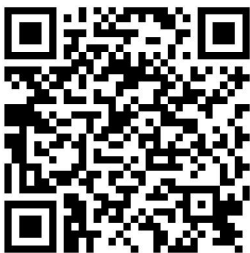
QR-Code für die Gartenarbeitschule